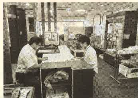
参加店舗打ち合わせの様子

若者の力で、市民や全国の方に岩国の魅力を知ってもらいたい、地元を元気にしたいという思いから、意欲的にふるさと岩国の地域活性化に取り組んでいます。