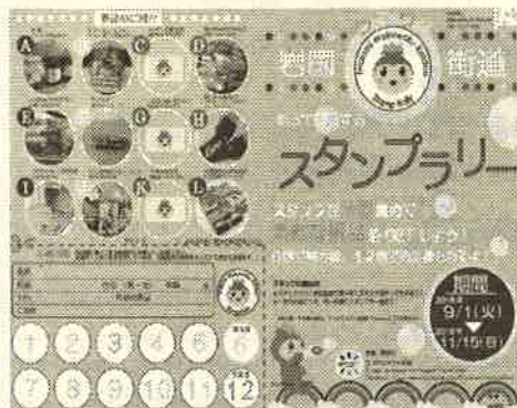
スタンプラリーシート

県内外の人や若者が集まり、岩国の魅力を再認識してもらいたいきっかけとなりそうです。皆さんもぜひ参加してみてくださいはいかがですか。