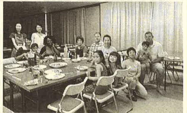
日米交流クッキングの様子

8月22日に「ジャパニーズチキンカレー&サラダ」を作りました。次回、9月3日(土)10:30~13:30に愛宕供用会館で、同じメニューで「日米交流親子クッキング」を開催します。(要申込み)