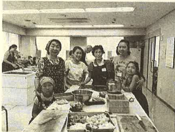
「ジャパニーズチキンカレー&サラダを作りました」

『私の大好きな日本を外国人の方々にも、もっと楽しんでもらって日本の良さを分かってもらえたら』という想いからでした。