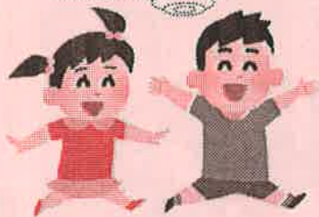
*教室のチラシ（一部）

ご家庭でのお悩み ・遊び方が分からない ・ごはん・寝替え・外出などの毎日の対応に困っている