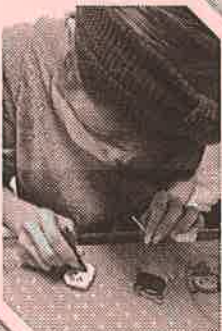
▲アイシングクッキー教室

何でも便利な世の中だからこそ、不便を楽しむ! そんな教育を今後も続けて行きたいと思います。