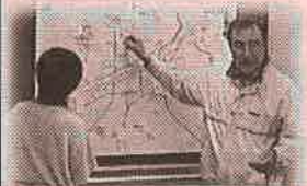
玖珂かるたで史跡めぐり 玖珂町ふるさと再生の会