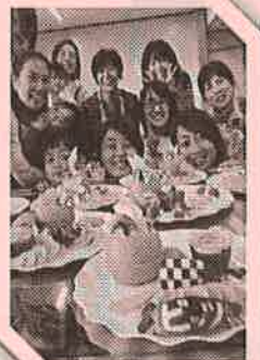
▶カッティングフルーツ教室