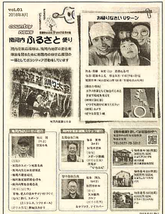
▲Vol1 南河内ふるさと便り

河内空家応援隊は、平成26年6月に立ち上げ、現在の会員数は14名で活動しています。活動状況として、地区別に空き家の戸別訪問の実施、また岩国市へ空き家の情報提供を行っています。