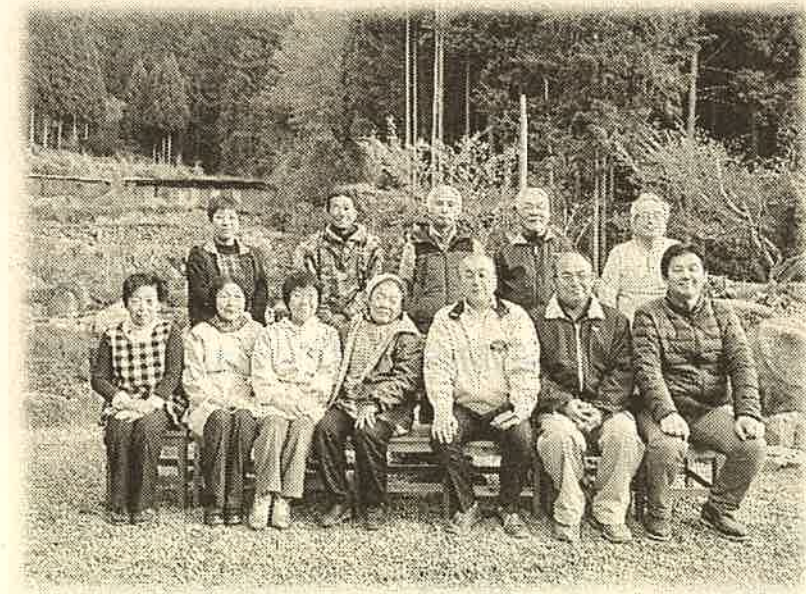
▲美川地区定住促進協議会との交流会

会として移住者を地域へ紹介する「河内移住便り」を発行し南河内地区全戸（600軒）へ配布を行っています。今年度からは、岩国市みんなの夢をはぐくむ交付金を利用し配布先を南河内のみではなく、美川地区まで（1,200軒）配布し、広報誌の名称を「南河内ふるさと便り」に変え、年4回発行します。